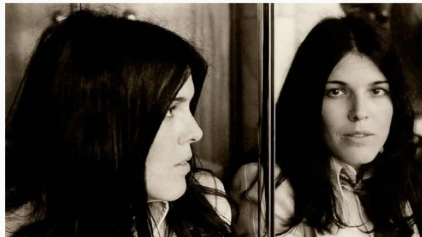
La cantautora Cecilia, fallecida en un accidente de tráfico hace 45 años.