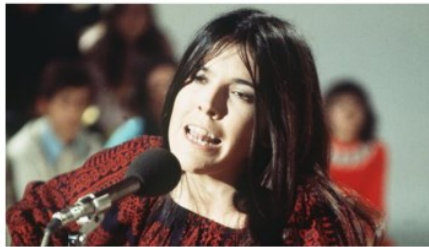
Cecilia - ABC

• Cuando se cumplen 45 años de su muerte en accidente de tráfico, recordamos a la cantante y su legado en conversación con Lidia Pujol, que ha grabado un precioso disco de versiones