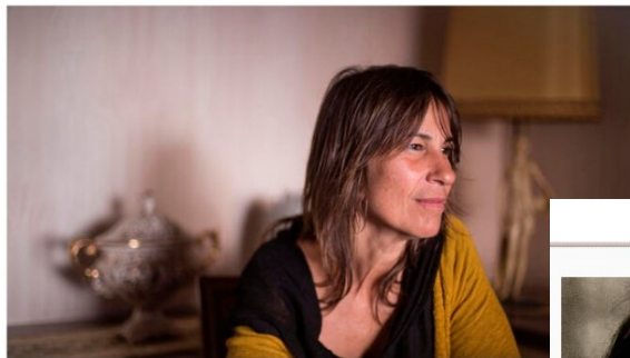
La cantante e intérprete, Lidia Pujol.